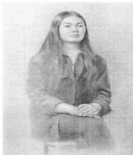
Сурет бойынша отырыс үлгісі