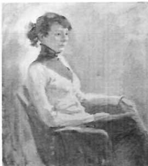
Кескіндеме бойынша тапсырма үлгісі